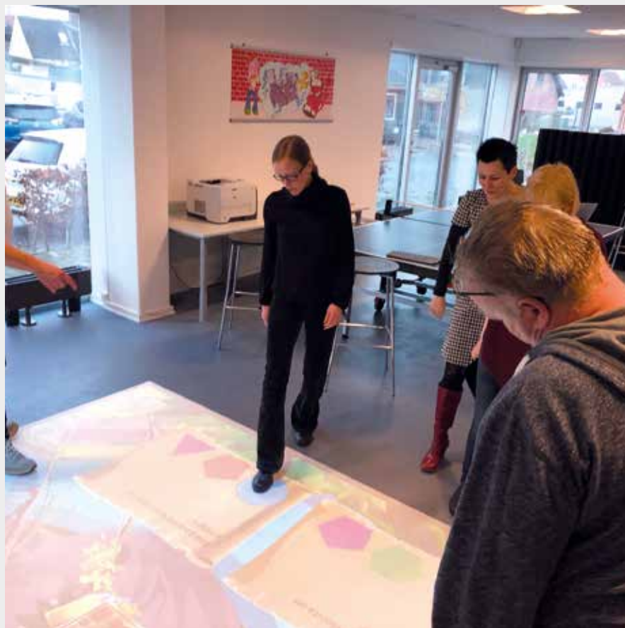
Med active floor sætter vi blandt andet fokus på bevægelse i undervisningen

VUC Storstrøm spænder over et område på omkring 3400 km 2 med ca. 270.000 indbyggere og er fordelt på seks lokale afdelinger med cirka 100 kilometer mellem Nakskov og Næstved.